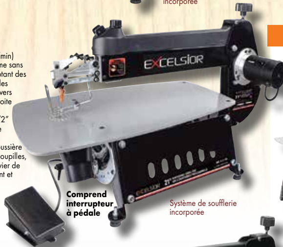
Comprend interrupteur à pédale