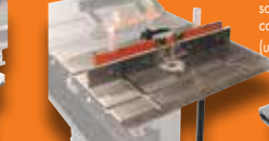
TABLE À TOUPIE ET GUIDE INDUSTRIELLE KRT-100