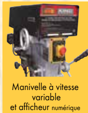
Manivelle à vitesse variable et afficheur numérique