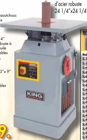
Table inclinable en fonte d'acier robuste 24 1/4" x 24 1/4"