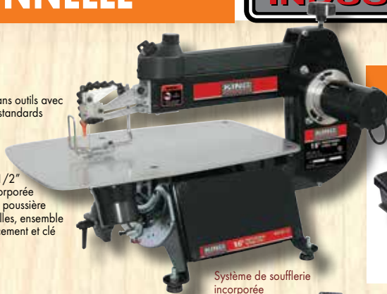
Système de soufflerie incorporée