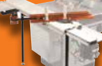
TABLE COULISSANTE INDUSTRIELLE KST-101