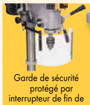
Garde de sécurité protégé par interrupteur de fin de