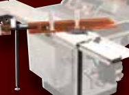
TABLE COULISSANTE INDUSTRIELLE KST-101