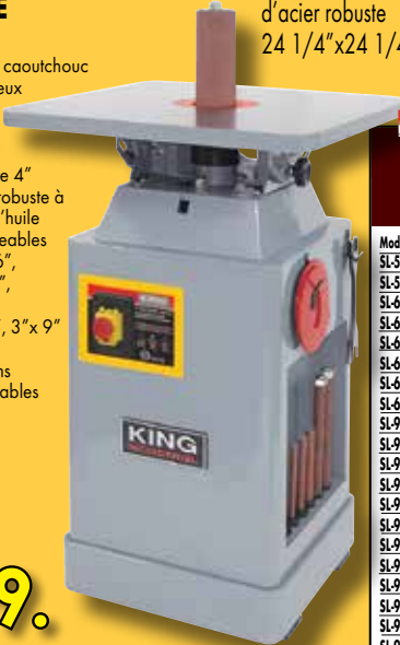
Table inclinable en fonte d'acier robuste 24 1/4" x 24 1/4"