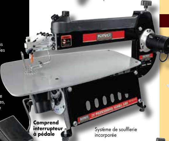
Comprend interrupteur à pédale