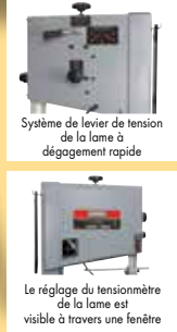
Système de levier de tension de la lame à dégagement rapide