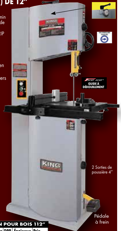
Jauge hydraulique pour la tension de la lame

20" x 16" Table solide en fonte d'acier inclinable de 5° vers la gauche et 45° vers la droite