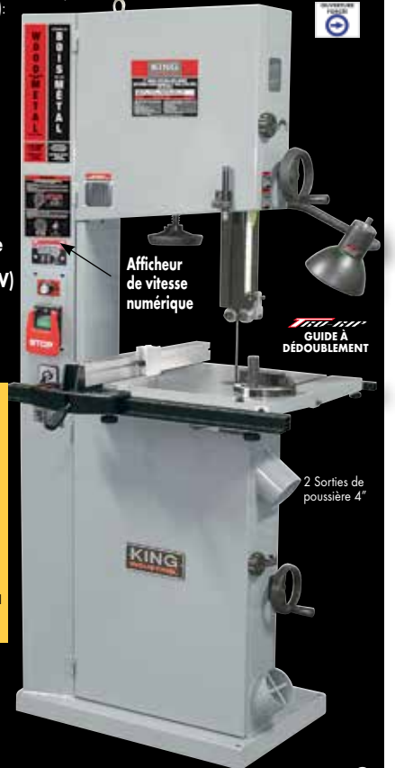
2 Sorties de poussière 4"

COMPREND: Lame pour le bois de 1/2" x 6 DPP, lame pour le métal de 1/2" x 10 DPP, guide à laser, lampe de travail, guide à onglets et système de guide à refendre de précision "TRU-RIP" en aluminium avec guide à dédoublement