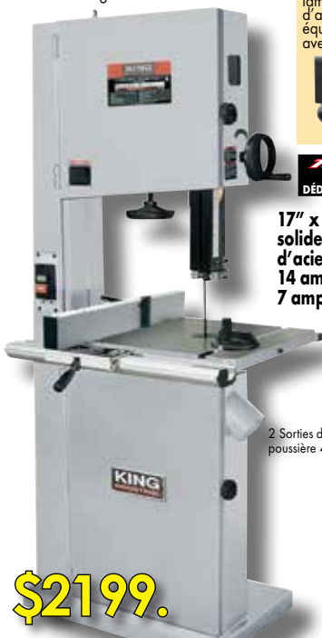
2 Sorties de poussière 4"

17" x 17" Table solide en fonte d'acier 14 amp. @ 110V 7 amp. @ 220V