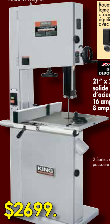
2 Sorties de poussière 4"

21" x 21" Table solide en fonte d'acier 16 amp. @ 110V 8 amp. @ 220V