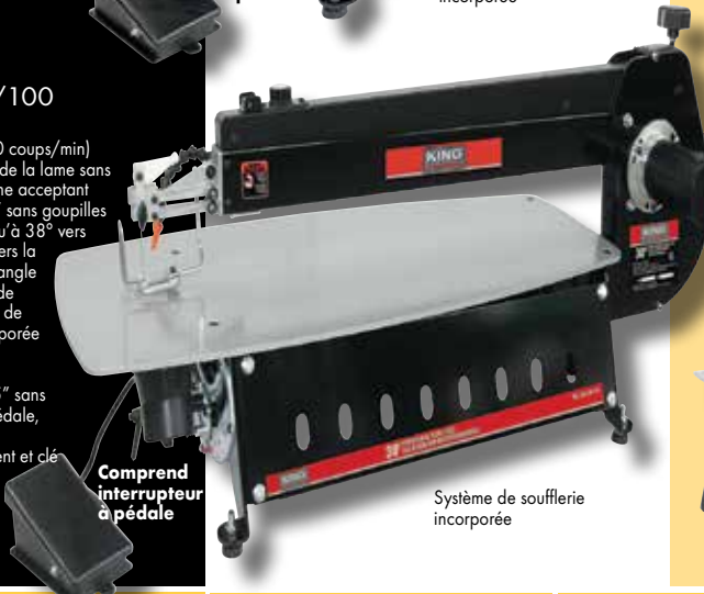
Comprend interrupteur à pédale