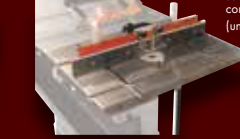
TABLE À TOUPIE ET GUIDE INDUSTRIELLE KRT-100