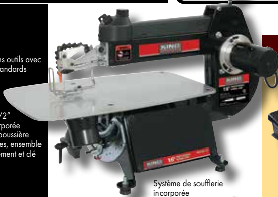
Système de soufflerie incorporée