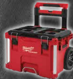
Boîte à outils sur roues PACKOUT MC 48-22-8426 129 95 $