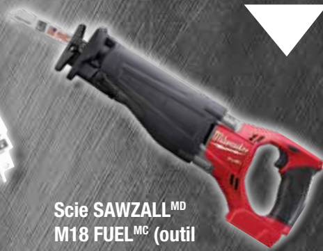
Scie SAWZALL MD M18 FUEL MC (outil seulement) 2720-20