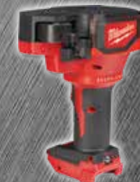
M18 CUTTER à tige filetée sans brosse, 2872-20 449 00 $