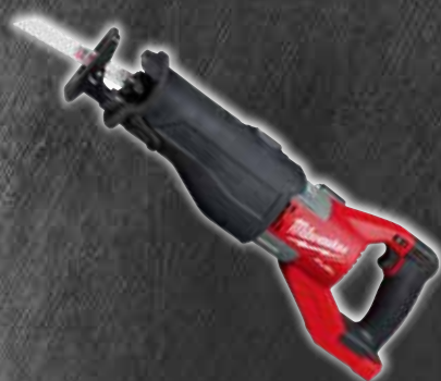
Super SAWZALL M18 FUEL – Outil seulement, 2722-20 319 00 $