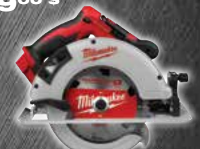
Lames M18 de 18,4 cm (7-1/4 po) pour scie circ. – Outil seulement, 2631-20 199 00 $