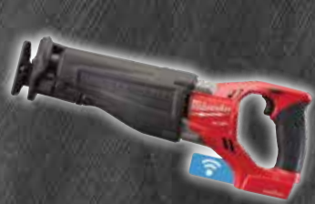
SAWZALL M18 FUEL – Outil seulement, 2721-20 289 00 $