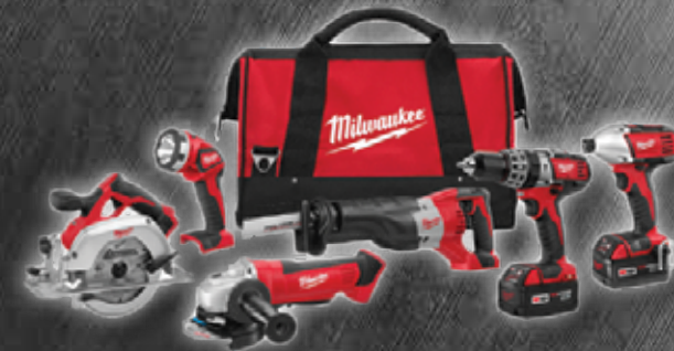
Ensemble de 6 Outils M18 FUEL MC , 2696-26 649 00 $