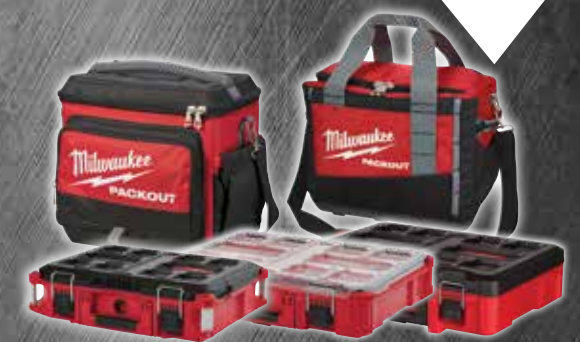
48-22-8450, 48-22-8430, 48-22-8302, 48-22-8321 OU 48-22-8424