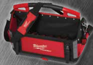
Sac fourre-tout PACKOUT MC de 20 po, 48-22-8320 179 95 $