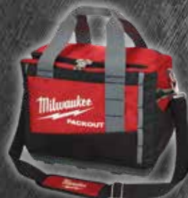
Sac à outils PACKOUT MC de 15 po, 48-22-8321 74 95 $