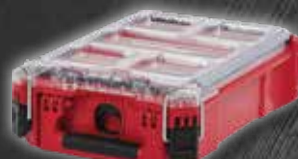
Organiseur compact PACKOUT MC , 48-22-8435 44 95 $