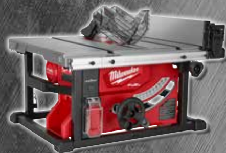
Scie circulaire M18 FUEL – Outil seulement, 2736-20 579 00 $