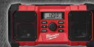
Radio de chantier M18 MC , 2890-20 149 00 $