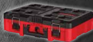
Mallette à outils w / Insert personnalisable PACKOUT MC , 48-22-8450 95 95 $