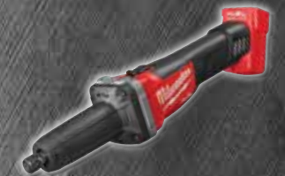
Meuleuse à rectifier les matrices de 6 mm (1/4 po) M18 FUEL – Outil seulement, 2784-20 199 00 $