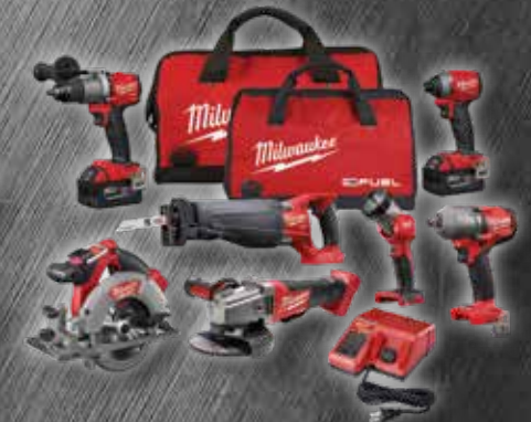
Ensemble de 7 Outils M18 FUEL MC , 2997-27 1,299 00 $