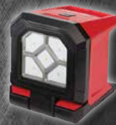
Projecteur à DEL sur support M18 MC ROVER MC , 2365-20 149 00 $