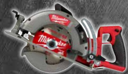
Scie circulaire M18 FUEL à manche arrière - outil seulement, 2830-20 349 00 $