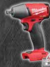
Clé à chocs de 1/2 po M18 FUEL avec cheville d'arrêt – Outil seulement, 2755B-20 199 00 $