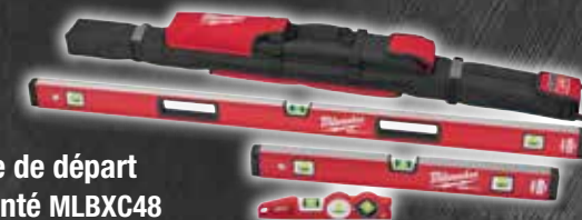
Ensemble de départ non aimanté MLBXC48 249 95 $