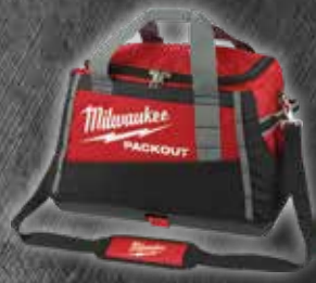
Sac à outils PACKOUT MC de 20 po, 48-22-8322 89 95 $