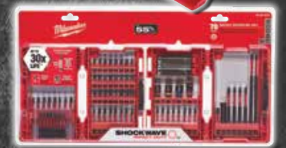
Jeu de 70 embouts pour perceuse à percussion, 48-32-4021 Cordeau traceur gras avec enrouleur, couleur bleue, 48-22-3982 Marteau de cadrage à face usinée de 624 g (22 oz), 48-22-9022