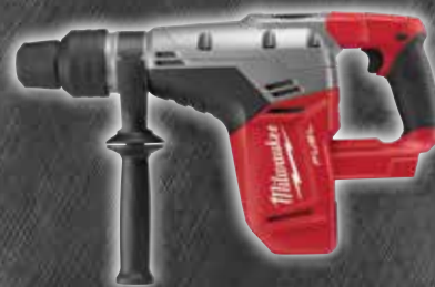
Marteau SDS Max de 1-9/16 po M18 FUEL – outil seulement, 2717-20 679 00 $