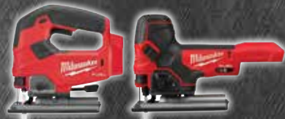
Scie sauteuse M18 FUEL – Outil seulement, 2737-20/2737B-20 229 00 $