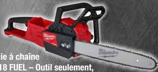
Scie à chaîne M18 FUEL – Outil seulement, 2727-20 398 00 $