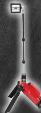
Lampe sur tour M18 ROCKET à deux blocs-piles avec ONE-KEY – Outil seulement, 2120-20 669 00 $