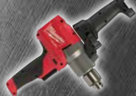
Mélangeur à boue M18 FUEL – Outil seulement, 2810-20 279 00 $