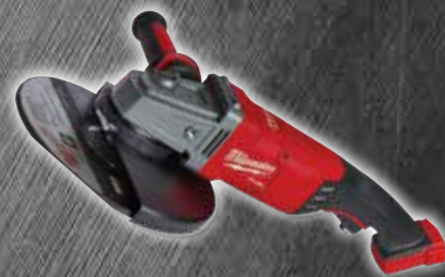
Grande meuleuse d'angle M18 FUEL de 7/9 po à puissance maximale – Outil seulement 2785-20 349 00 $