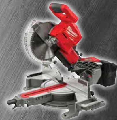
Scie à onglets de 10 po M18 FUEL – Outil seulem., 2734-20 599 00 $