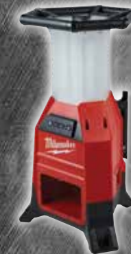
Lampe de chantier M18 RADIUS – Outil seulement, 2151-20 619 00 $