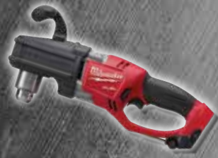
M18 FUEL Super Hawg de 1/2 po – Outil seulement, 2707-20 349 00 $