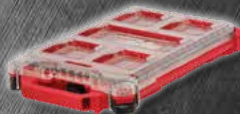
Organiseur compact à profil bas PACKOUT MC , 48-22-8436 33 95 $