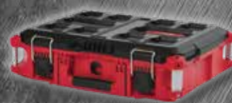
Boîte à outils PACKOUT MC , 48-22-8424 89 95 $