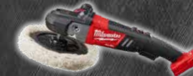
Polisseuse M18 FUEL, 2738-20 319 00 $