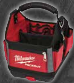
Sac fourre-tout PACKOUT MC de 10 po, 48-22-8310 119 95 $