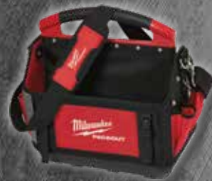
Sac fourre-tout PACKOUT MC de 15 po, 48-22-8315 144 95 $