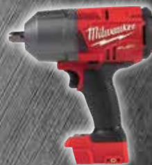
Clé à chocs à couple élevé de 1/2 po M18 FUEL avec cheville d'arrêt – Outil seulement, 2766-20 249 00 $