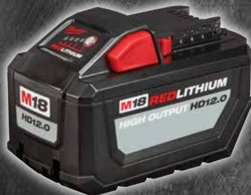
Bloc-pile M18 REDLITHIUM MC HIGH OUTPUT MC 12.0, 48-11-1812