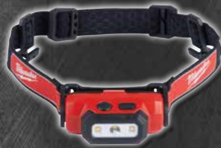
Lampe pour casque de protection 2111-21 71 99 $