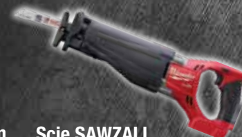
Scie SAWZALL M18 FUEL, 2720-20 199 00 $