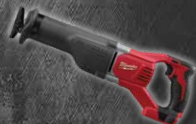
Scie alternative M18 FUEL MC SAWZALL MD (outil seulement), 2621-20 159 00 $