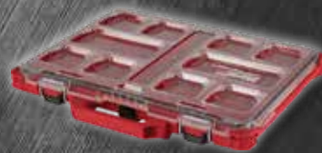
Organiseur à profil bas PACKOUT MC , 48-22-8431 56 95 $