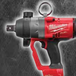
M18 FUEL Clé à chocs à couple élevé de 1 avec ONE-KEY, 2867-20 899 00 $