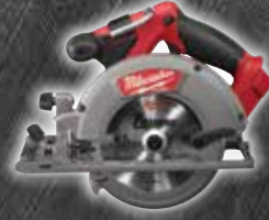
Scie circulaire de 6-1/2 po M18 FUEL – Outil seulement, 2730-20 229 00 $