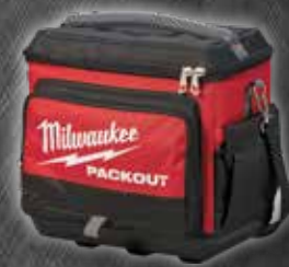
Glacière PACKOUT MC , 48-22-8302 89 95 $