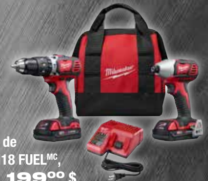
Ensemble de 2 Outils M18 FUEL MC , 2697-22CT 199 00 $