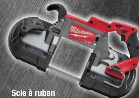
Scie à ruban M18 FUEL – Outil seulement, 2729-20 419 00 $