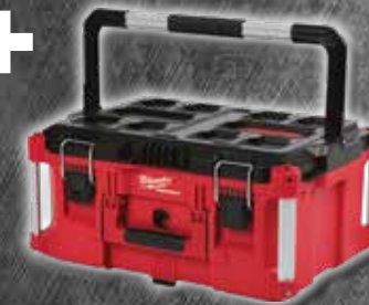
Grande boîte à outils PACKOUT MC 48-22-8425 100 00 $