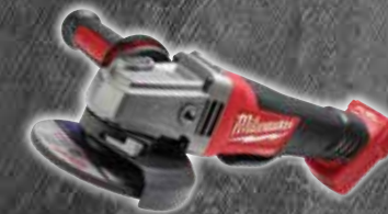
Meuleuse à interrupteur à palette de 4-1/2 po/5 po M18 FUEL – Outil seulement, 2780-20/2781-20 199 00 $