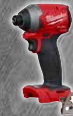
Visseuse à chocs hex. de 6 mm (1/4 po) M18 FUEL – Outil seulement, 2853-20 189 00 $