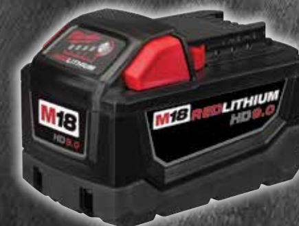
Bloc-piles M18 REDLITHIUM MC HIGH DEMAND MC 9.0, 48-11-1890