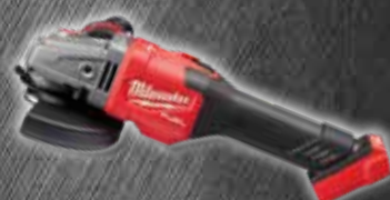
M18 FUEL Meuleuse de freinage 4-1/2" - 6", Commutateur à glissière, Lock-On, 2981-20 319 00 $