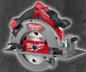
Scie circulaire M18 FUEL de 7-1/4 po – Outil seulement, 2732-20 289 00 $