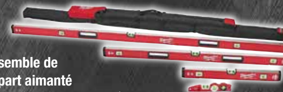
Ensemble de départ aimanté MLBXC78 459 95 $