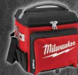
Glacière de chantier 48-22-3250 59 00 $