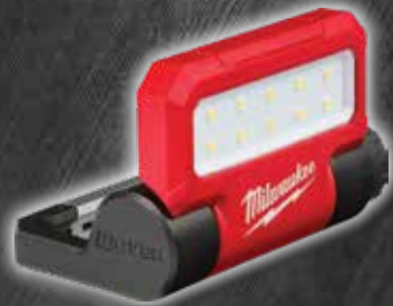
Projecteur pivotant à prise USB ROVER 2114-21 80 99 $