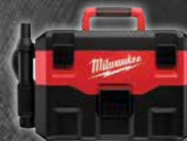
Aspirateur M18 MC de 2 gallons pour déchets solides et humides, 0880-20 149 00 $