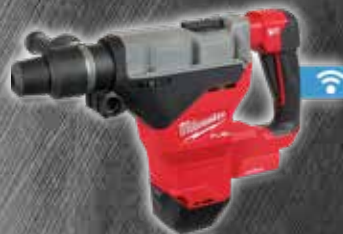
Perceuse à percussion SDS Max de 1-3/4 po – Outil seulement, 2718-20 949 00 $