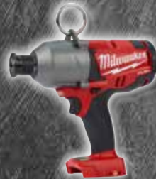
Tournevis tout usage de 7/16 po M18 FUEL – Outil seulement, 2765-20 449 00 $