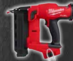
Cloueur brad M18 FUEL de calibre 18, 2746-20 279 00 $