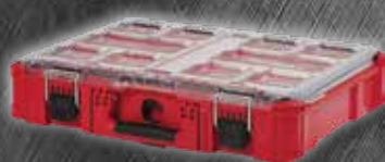
Coffre de rangement PACKOUT MC , 48-22-8430 64 95 $