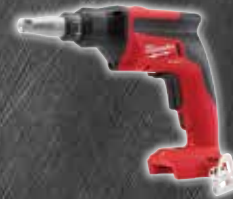
Pistolet à vis pour cloison sèche M18 FUEL – Outil seulement, 2866-20 $189 00 $