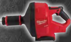
Furet de conduits M18 – Outil seulement, 2772A-20 439 00 $