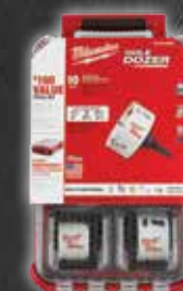
Ensemble de scies- cloches HOLE DOZER MC bimétalliques PACKOUT MC de 10 pièces, 49-22-5606 119 00 $