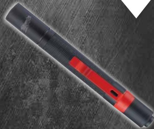
Crayon lumineux 2105